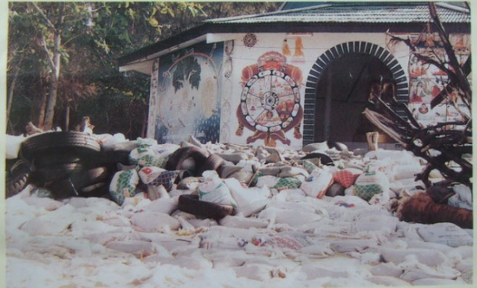
การต่อสู้เพื่อที่จะรักษาส่วนที่เหลือไว้โดยใช้กระสอบทราย

การพังทลายของธรรมสถานหาดทรายแก้ว ผลกระทบจากการก่อสร้างท่าเรือน้ำลึกสงขลา